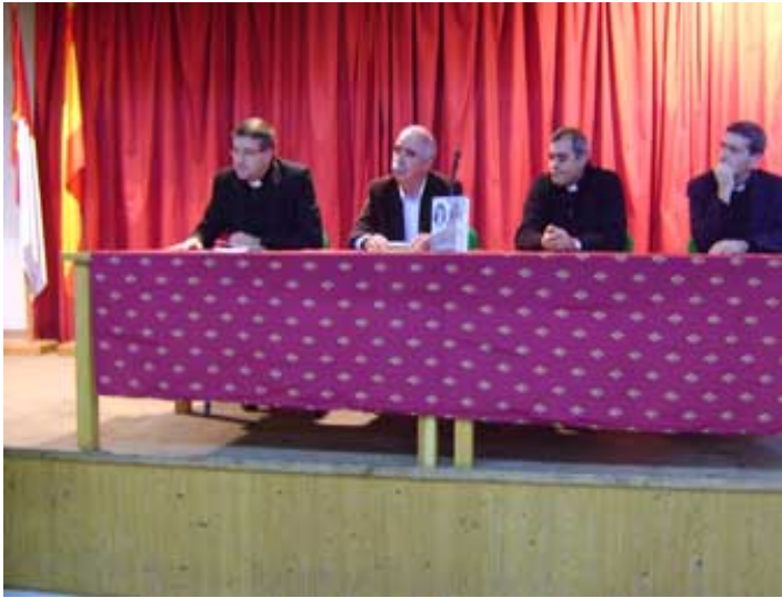
La mesa de los que intervinieron.

el dinero que se recaude en la venta del libro para las misiones diocesanas. En la mañana del 8 de diciembre se presentó el libro en Consuegra.